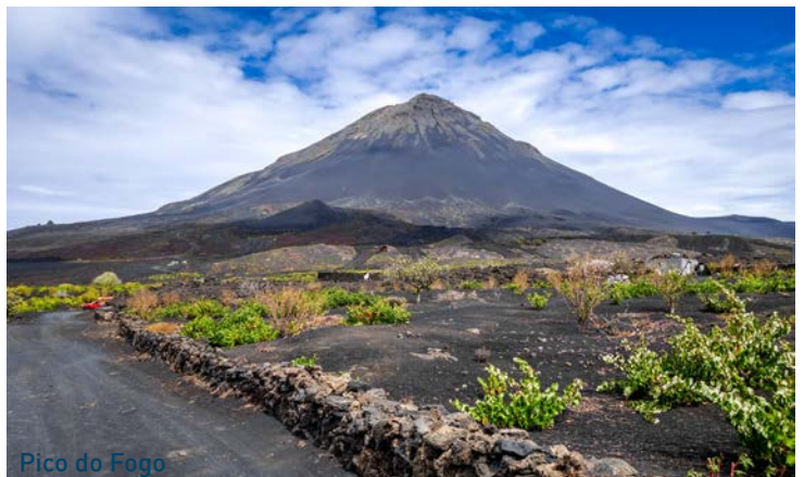
Pico do Fogo