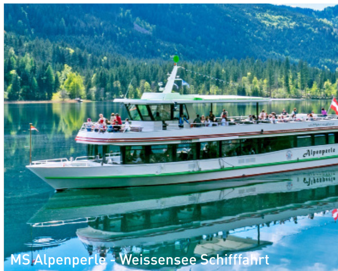
MS Alpenperle - Weissensee Schifffahrt

Hinweis: Programmänderungen aus organisatorischen, sicherheits- oder wetterbedingten Gründen vorbehalten. Es gelten unsere AGB's, einsehbar beim Reiseveranstalter bzw. unter www.reisegenuss.at